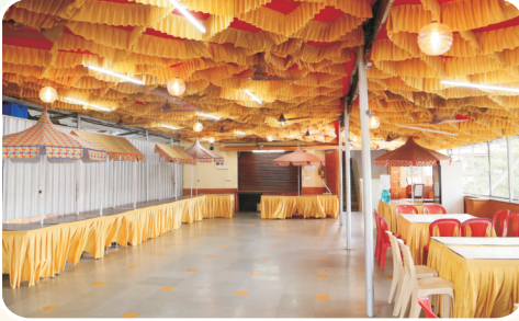
कै. इंदिराबाई सहदेव माईणकर सभागृह - भोजनकक्ष