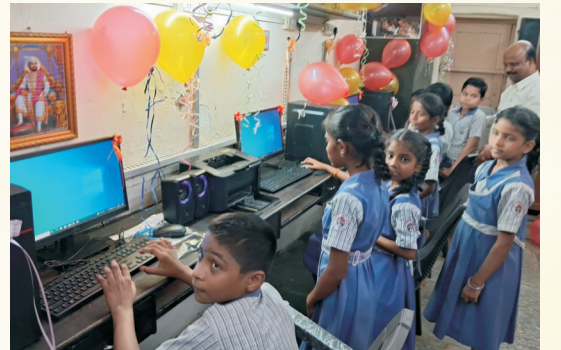
संगणक भेट प्रकल्प - राधाबाई साठे विद्यालय