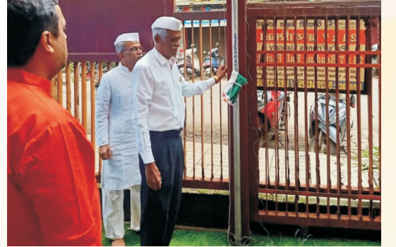
१५ ऑगस्ट रोजी झेंडा वंदन