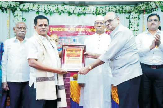
कै. आबासाहेब परुळेकर उद्योगरत्न पुरस्कार