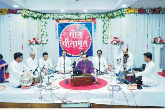
गीत गीतामृत संगीतमय कार्यक्रम