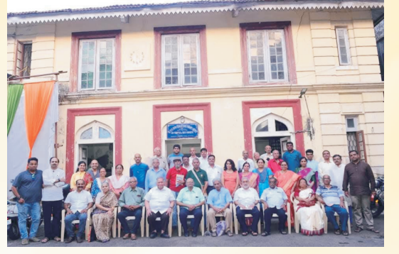
कुडाळदेशकर निवास, गिरगाव येथे वेबसाईट उद्घाटन