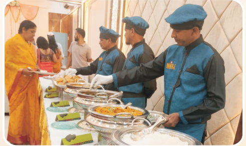
सुग्रास भोजनाची उत्तम सोय

बुकिंगसाठी संपर्क : सहयोग कार्यालय ९९२०७ ०२३७५ / ७०२१७५ २९२६