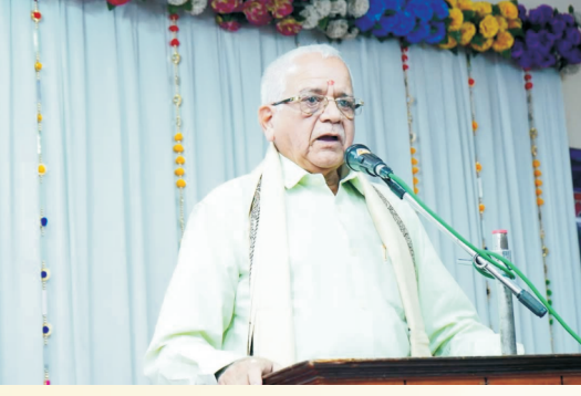
दिपक श्री. वालावलकर स्मृती कार्यकर्ता पुरस्कार २०२४