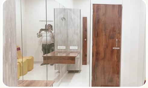
वधु-वरांसाठी सर्व सोयीयुक्त वातानुकूलित रुम्स