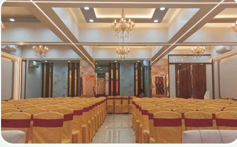
कै. अण्णासाहेब माईणकर सभागृह (वातानुकूलित)