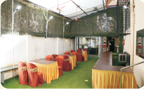
कुडाळदेशकर भवनाच्या आवारातील लॉन्स